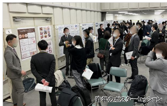
昨年のポスターセッション

皆さまの取り組みや実践報告、課題や困りごと等についてまとめたポスターを掲示いただき、参加者と自由に意見交換をしていただく時間です。地域リハの様々な取り組みや活動を通じ、専門職間、関係機関間との連携を深めることを目指します。また、ポスター報告や意見交換の中から、「地域社会に根ざした」の意味を参加者全員で考えます。